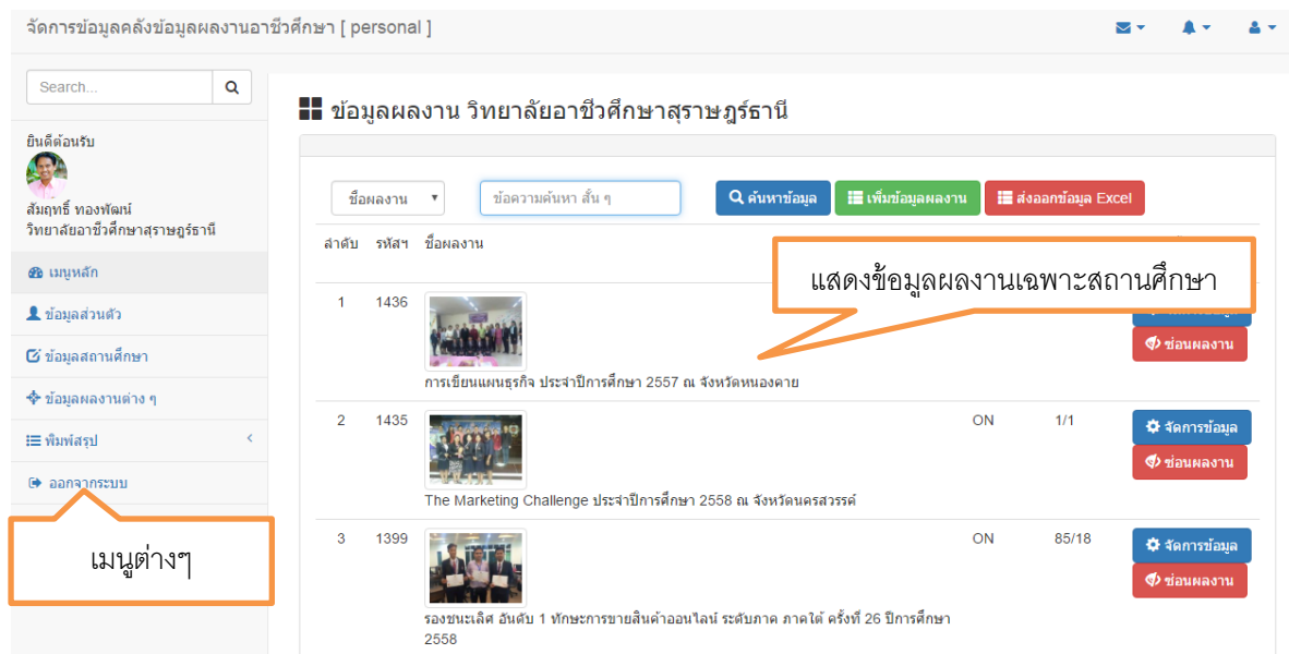
รูปที่ 4 หน้าจอแสดงผลข้อมูลผลงาน สำหรับสถานศึกษา

ผู้ใช้ป้อน รหัสสถานศึกษา และรหัสผ่าน ที่ได้จากระบบที่สมัครไว้ (หากจำไม่ได้ ให้กดปุ่ม ลืมรหัสผ่าน) ป้อนเสร็จเรียบร้อย กดปุ่ม เข้าสู่ระบบ แสดงดังรูปที่ 4