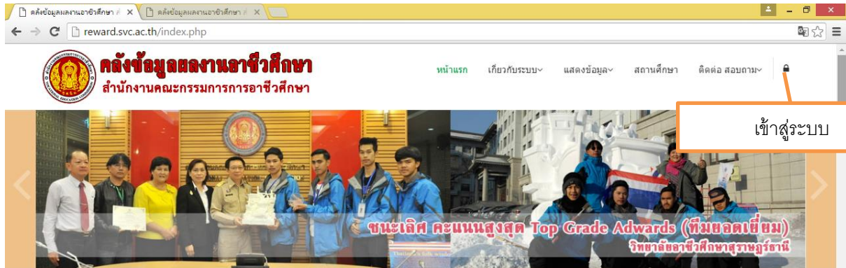
รูปที่ 1 หน้าแรกเว็บไซต์คลังข้อมูลผลงานอาชีวศึกษา

เข้าสู่เว็บไซต์ reward.svc.ac.th คลังข้อมูลผลงานอาชีวศึกษา แสดงดังรูปที่ 1